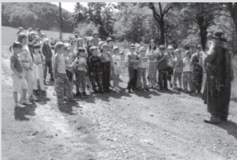
Putování za lesním mužikem se zúčastnilo 40 dětí. Akci zabezpečovalo šet dospělých.