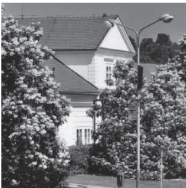
Vizovické předzámčí – „Kvetoucí katalpy“