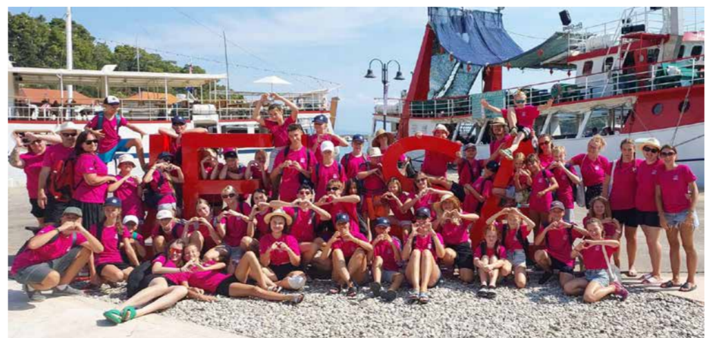
Vizovjáneek na festivalu v chorvatské Podgoře v srpnu 2024.